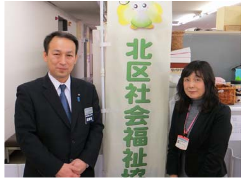
小倉氏が提言する「社会福祉協議会の重点活動」

理事長 そうですね、私達もそういうことを知らないもので、そういう講師も頼めるよと言うんであれば、みんなで話それをやるよという事になれば、お願いいたします。本日はありがとうございました。