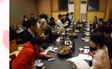
賑わいを見せる懇親会会場