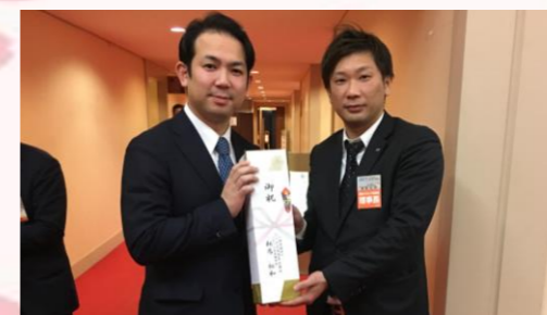
船山理事長と相馬理事長