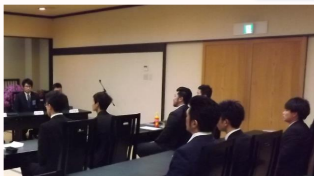
5名のオブザーバーが参加し、例会後の懇親会にも参加してくれました