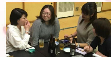
会場の一角では女子会も