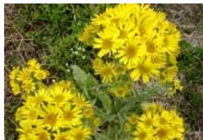
サワオグルマ 花言葉「恋のたより」

理事長 花言葉「恋のたより」そして、パワースポットというのが結びつきますね、この話が広まっていけば、また新たな名所になりますね。