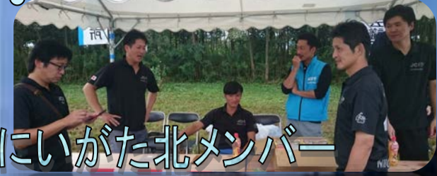
にいがた北メンバー