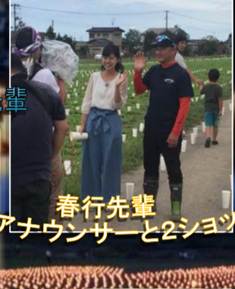
春行先輩 アナウンサーと2ショット