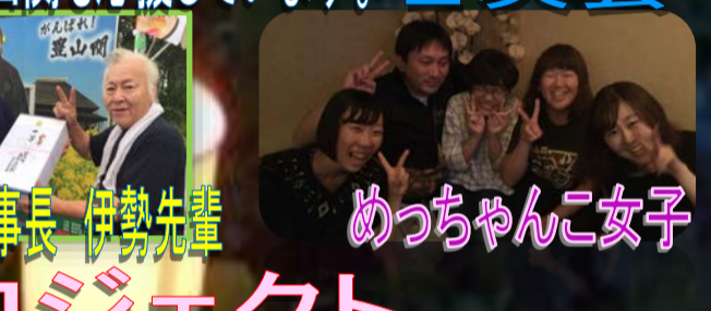
めっちゃんこ女子