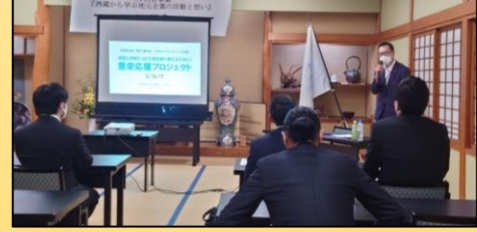
質疑応答では、様々な意見・質問や、講師への積極的な発言が多くあり、とても良い雰囲気でした。