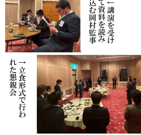
→立食形式で行われた懇親会

第二部では、異業種交流会として、懇親会を行いました。本事業では、オブザーバーとして5名の方にご参加いただき、職業を超えて異なる業界で働く参加者と交流を深めることができました。ビジネスチャンスやアイデアを共有することで、新たなビジネスネットワークを構築することもできるでしょう。