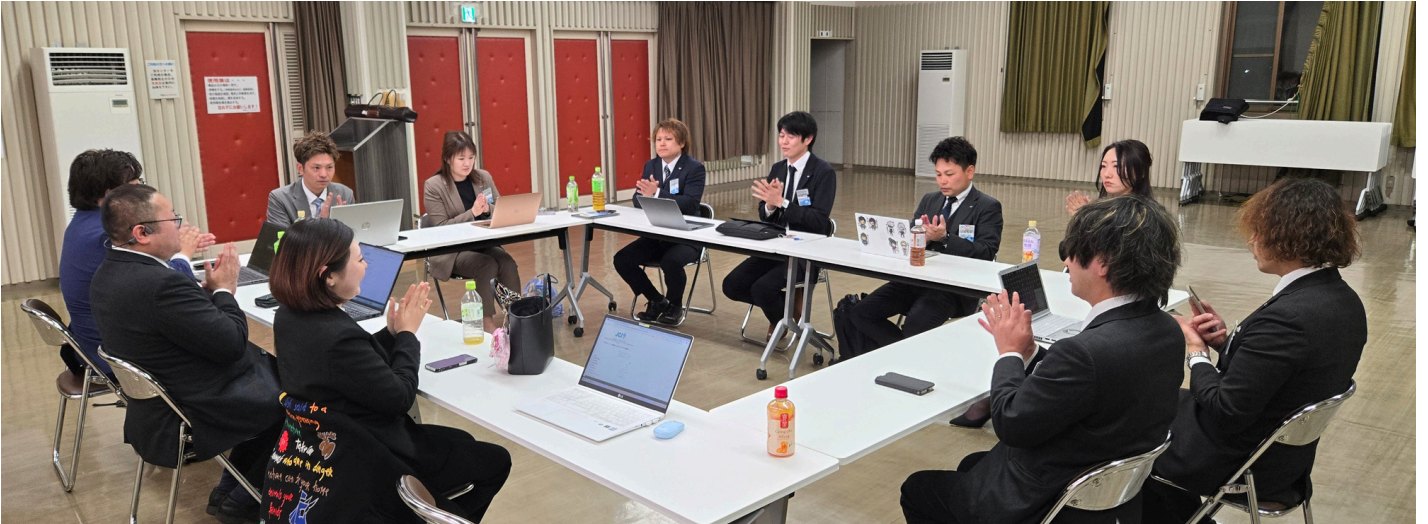
一般社団法人 いいがた北青年会議所 2026年度